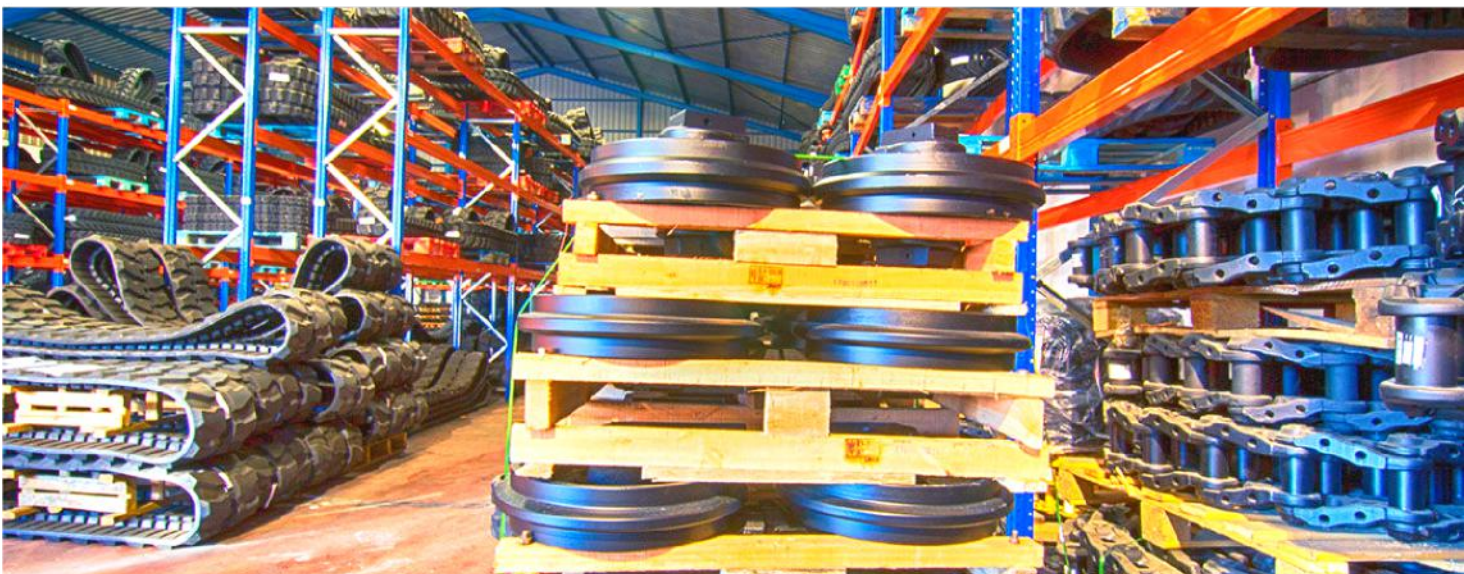
Instalaciones de Cohidrex

Estoy convencido que, en cualquier momento, y a pesar de la circunstancia que sean, siempre hay negocios que cubren las carencias que esa circunstancia determinada genera. Hay que tener una idea base, analizarlo bien, obtener la financiación acorde al proyecto y tener mucha determinación y capacidad de trabajo para sacarlo adelante. Pero una buena idea de negocio, aplicándole ilusión y mucho trabajo, siempre es capaz de vencer a todas las adversidades.