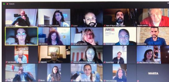
Mesa redonda de Cáceres Impulsa con nómadas digitales

En concreto, citaron algunas de las ayudas en vigor, como la destinada a la rehabilitación a la vivienda, la concesión de ayudas económicas por natalidad, incentivos para la adquisición de equipamiento y software, así como las ayudas destinadas a la implantación de soluciones de teletrabajo y emprendimiento digital