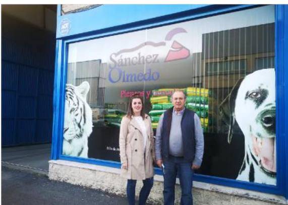
Sánchez Olmedo Productos Agroganaderos